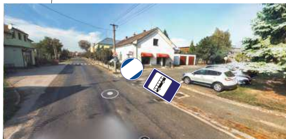
Posunutí autobusové zastávky v momentě, kdy stávající autobusová zastávka bude v pracovním záběru.