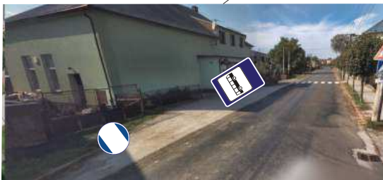
Posun autobusové zastávky bude cca na 1 týden / 1 strana